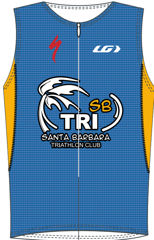
FRONT / DEVANT