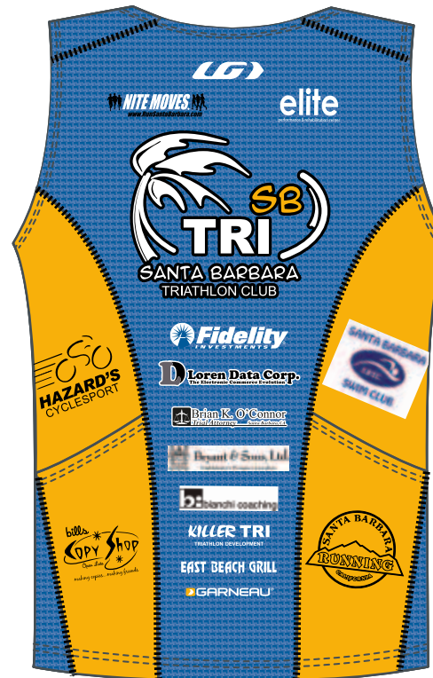
BACK / DOS